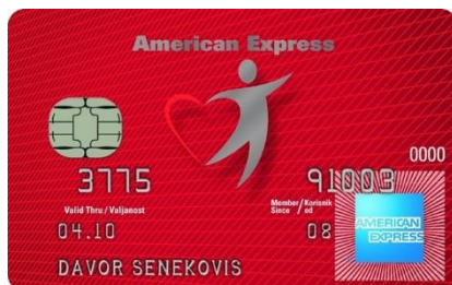
Slika 3: Specijalna edicija kreditne kartice Kartica sa srcem

na internetskim stranicama www.cinimdobro.hr korisnicima svih American Express te svih MasterCard, Maestro i Visa kartica, bez obzira na banku izdavatelja.