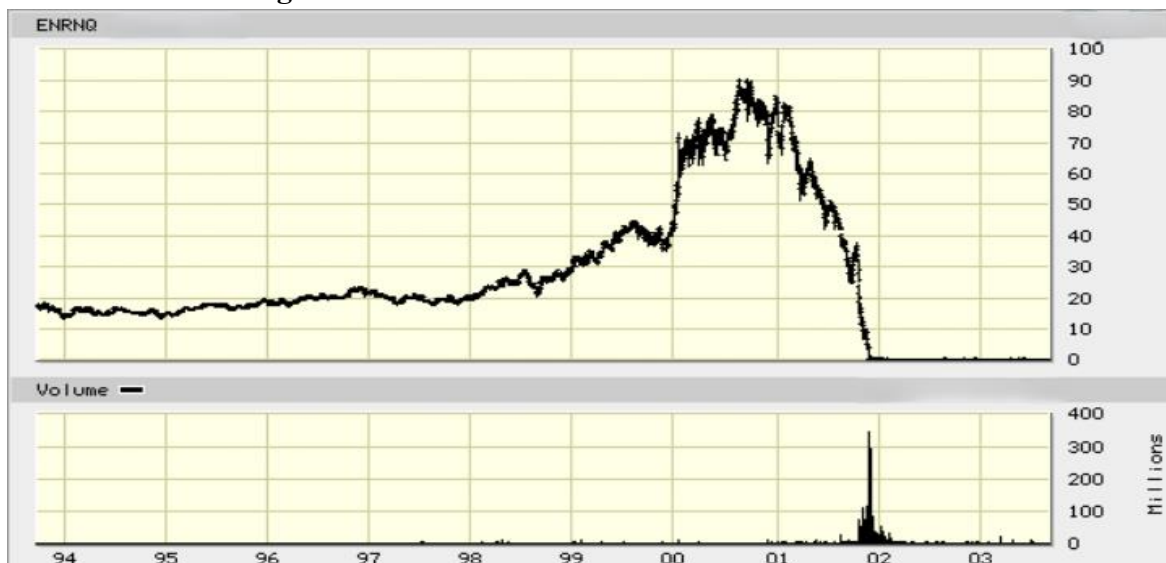
Slika 2. Kretanje cijene dionice Enrona u razdoblju 1994. – 2003 usklađeno s podjelom dionica 2:1 iz 1999. godine.