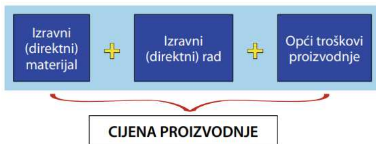
Slika 5: Troškovi koji se uključuju u cijenu proizvodnje

Izvor: Vuk, J. (2024). Posebnosti godišnjih financijskih izvještaja u proizvodnoj djelatnosti za 2023. godinu. Računovodstvo, revizija i financije 2/2024, str. 56.