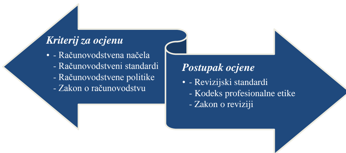
Slika 1.: Kriteriji i postupak ocjene financijskih izvještaja

Uz opisano, važno je spomenuti i kriterije te postupak ocjene financijskih izvještaja. Naime, uvijek se ističe kako su temeljni kriteriji za ocjenu izvješća računovodstvena načela, računovodstveni standardi, računovodstvene politike te zakoni, dok su i revizijski standardi, Zakon o reviziji, kao i Kodeks profesionalne etike revizora od velike važnosti kod postupka ocjene. „Revizorsko društvo dužno je sastaviti revizorsko izvješće o obavljenoj zakonskoj reviziji godišnjih financijskih izvještaja ili godišnjih konsolidiranih financijskih izvještaja u skladu s Međunarodnim revizijskim standardima, odredbama ovoga Zakona i drugim propisima.“ 19 Slikovit prikaza opisanog se nalazi na slici niže.