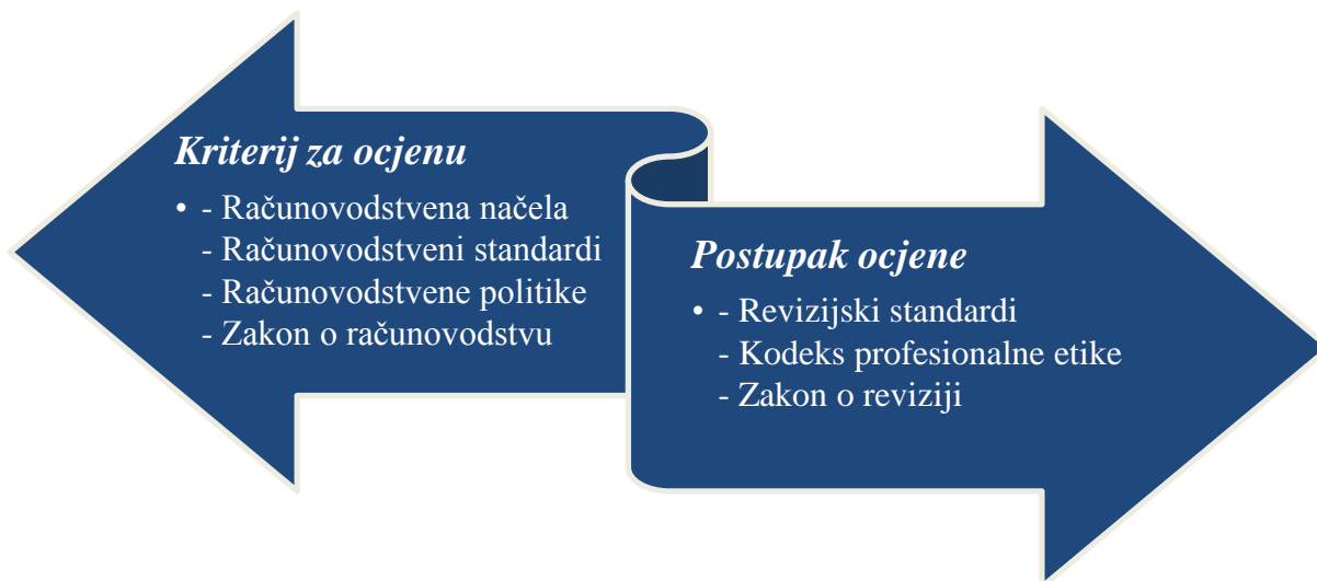
Slika 1.: Kriteriji i postupak ocjene financijskih izvještaja

Uz opisano, važno je spomenuti i kriterije te postupak ocjene financijskih izvještaja. Naime, uvijek se ističe kako su temeljni kriteriji za ocjenu izvješća računovodstvena načela, računovodstveni standardi, računovodstvene politike te zakoni, dok su i revizijski standardi, Zakon o reviziji, kao i Kodeks profesionalne etike revizora od velike važnosti kod postupka ocjene. „Revizorsko društvo dužno je sastaviti revizorsko izvješće o obavljenoj zakonskoj reviziji godišnjih financijskih izvještaja ili godišnjih konsolidiranih financijskih izvještaja u skladu s Međunarodnim revizijskim standardima, odredbama ovoga Zakona i drugim propisima.“ 19 Slikovit prikaza opisanog se nalazi na slici niže.