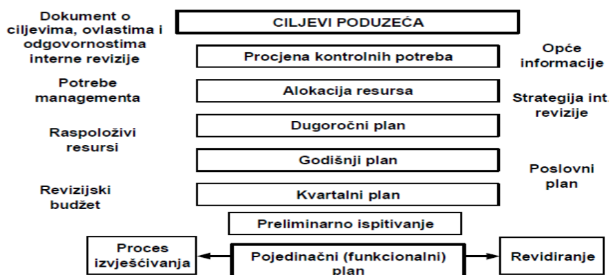
Slika 2: Proces planiranja interne revizije