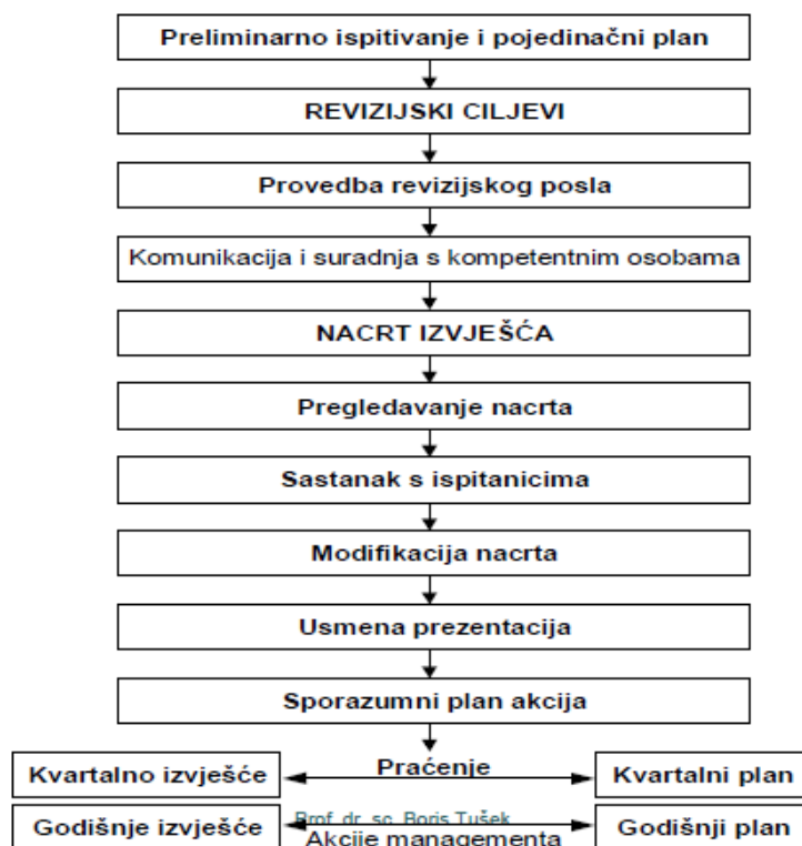
Slika 5: Proces izvješćivanja internog revizora