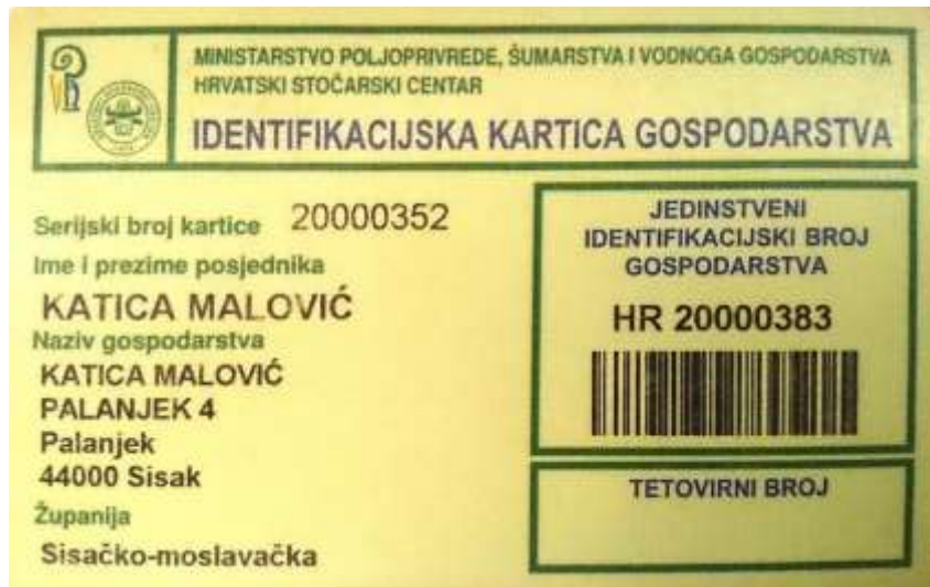
Slika 1. Iskaznica obiteljskog poljoprivrednog gospodarstva

Važnu ulogu ima Hrvatska poljoprivredna agencija - HPA koja sadrži potrebne podatke o stoci i MIBPG 2 koji ima ulogu šifre kojom se elektronski razmjenjuju podaci. Kao dokaz upisa u Upisnik poljoprivrednih gospodarstava nositelj i članovi dobivaju iskaznicu obiteljskog poljoprivrednog gospodarstva koja vrijedi uz osobnu iskaznicu.