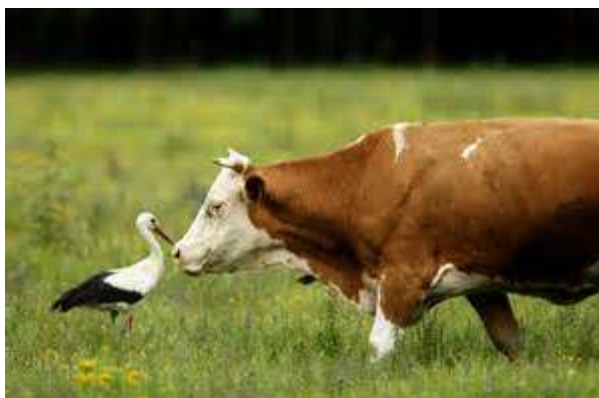
Slika 4. Bioraznolikost pašnjaka Lonjskog polja