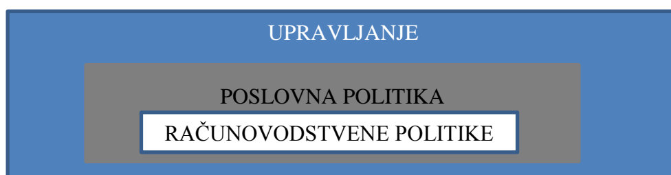
Slika 1: Odnos računovodstvenih politika i poslovne politike

Zbog toga financijska izvješća moraju biti realna i prikazivati vjerodostojnu sliku stvarnog poslovanja. U tom kontekstu vrlo važnu ulogu imaju računovodstvene politike jer se njima može utjecati na vrijednost pozicija financijskih izvješća. Stoga je bitno da je menadžment upoznat sa mogućnostima utjecaja na financijski položaj i uspješnost poslovanja putem računovodstvenih politika kako bi uspješno provodio poslovne politike.