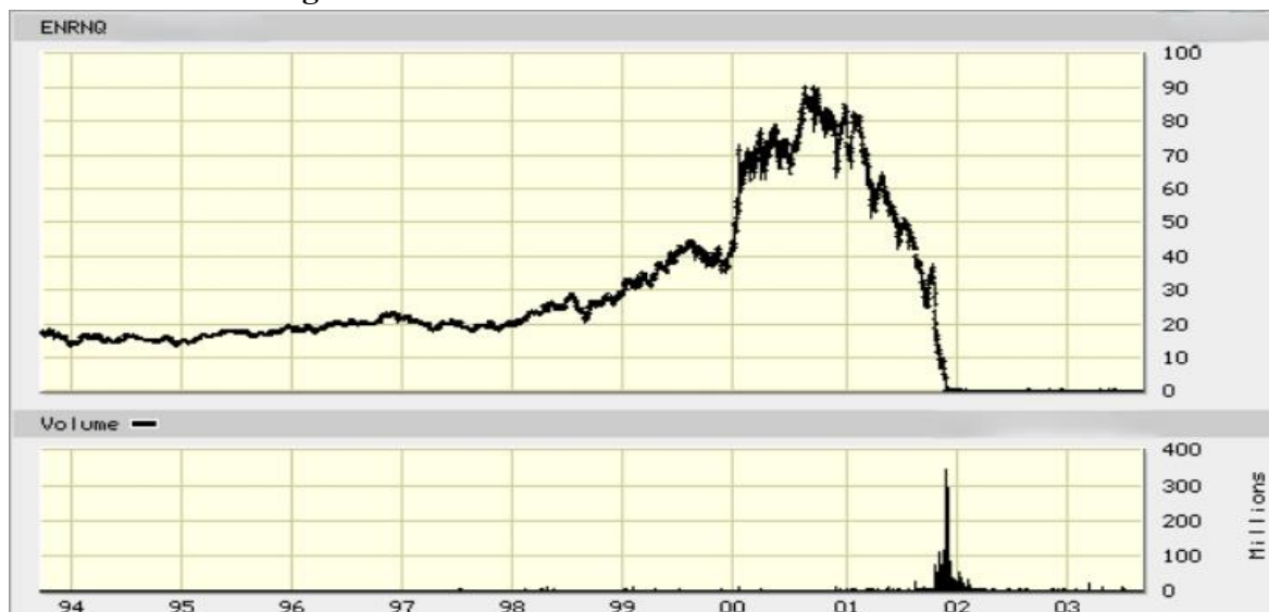
Slika 2. Kretanje cijene dionice Enrona u razdoblju 1994. – 2003 usklađeno s podjelom dionica 2:1 iz 1999. godine.

Izvor slike: Begin to Invest (2023). A Brief History of Enron – With Enron Stock Chart. Raspoloživo na: URL: https://www.begintoinvest.com/enron-stock-chart/