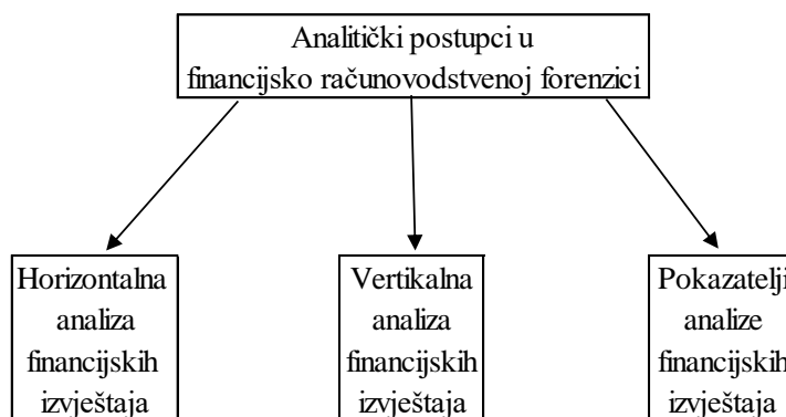
Slika 1: Analitički postupci u financijsko računovodstvenoj forenzici

Dakle, u istraživanjima i otkrivanju prijevare u financijskim izvještajima značajnu ulogu imaju analitički postupci, odnosno izračuni različitih pokazatelja temeljem financijskih izvještaja. Sva značajna odstupanja od iskustvenih i očekivanih vrijednosti predstavljaju „crvene zastavice” 29 . Kvalitativni znakovi upozorenja važni su dijelovi znakova za signaliziranje vjerojatnosti prijevare u financijskim izvještajima. U provedbi analitičkih postupaka računovodstveni forenzičar najčešće primjenjuje analitičke postupke financijsko računovodstvene forenzike kako je prikazano na sljedećoj slici.