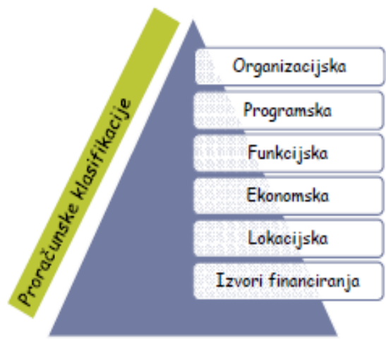
Slika 3: Proračunske klasifikacije

Suvremeni sustav proračunskog računovodstva se najviše oslanja na organizacijsku, funkcijsku i ekonomsku klasifikaciju, uz sve prisutniju potrebu ugradnje i programske klasifikacije u proces planiranja i izvještavanja o ostvarenim učincima realiziranih aktivnosti i projekata.