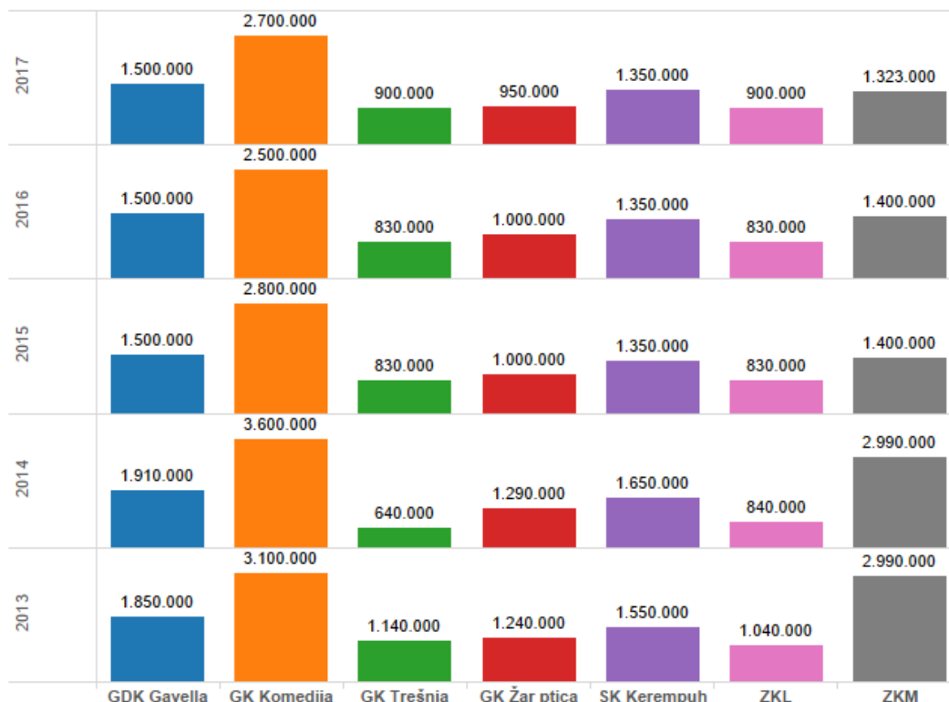
Slika 21: Programska sredstva javnih ustanova u kulturi Grada Zagreba 2013.-2017.