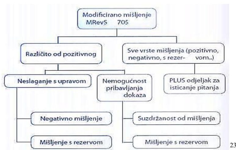
Slika 2. Podjela modificiranih mišljenja