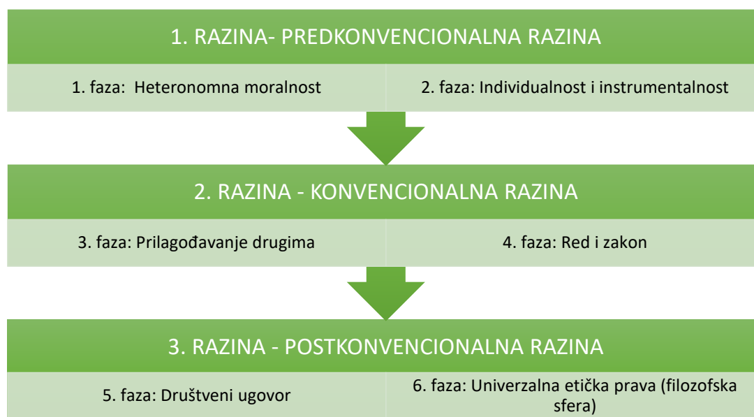
Slika 1: Kohlbergove razine i faze moralnog rasuđivanja