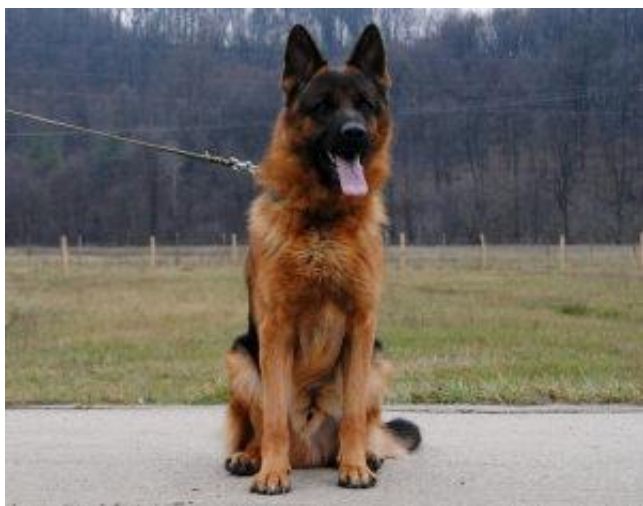
Slika 4: Pas pasmine njemački ovčar