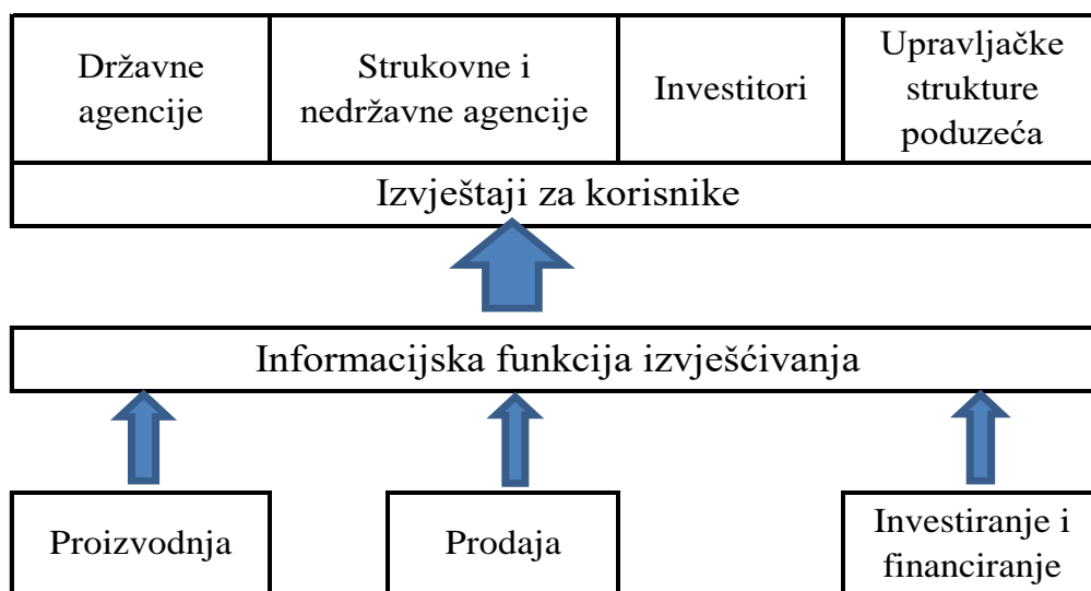
Slika 1: Informacijska funkcija izvještavanja