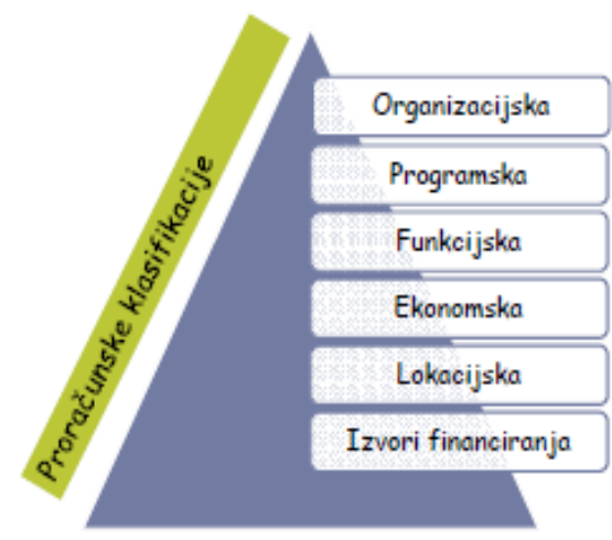
Slika 3: Proračunske klasifikacije

Suvremeni sustav proračunskog računovodstva se najviše oslanja na organizacijsku, funkcijsku i ekonomsku klasifikaciju, uz sve prisutniju potrebu ugradnje i programske klasifikacije u proces planiranja i izvještavanja o ostvarenim učincima realiziranih aktivnosti i projekata.