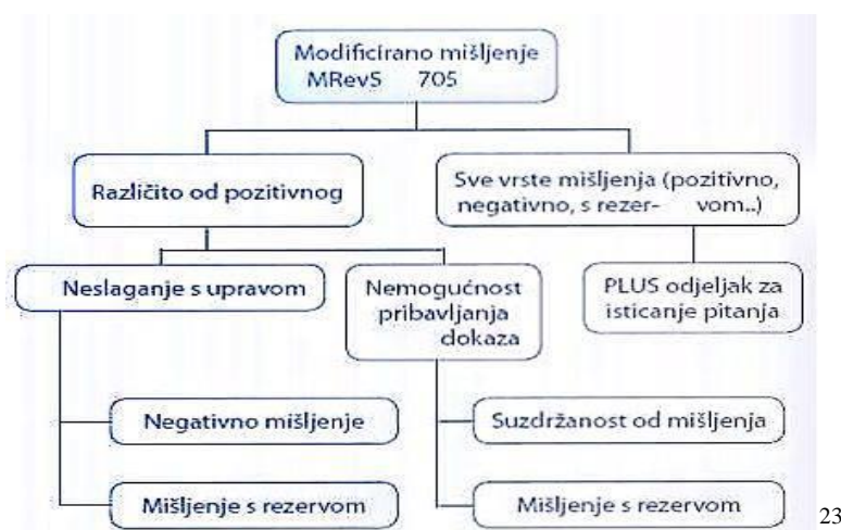
Slika 2. Podjela modificiranih mišljenja